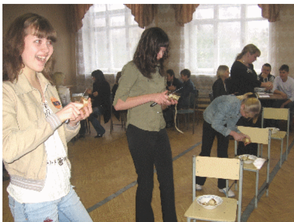
Участники конкурса за работой.

Одиннадцатиклассники, команда которых называлась "Fanta",